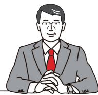
高知市長 桑名 龍吾