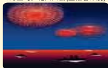
7月～8月、花火大会(主催者は別)