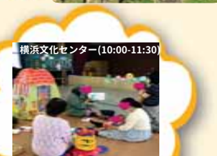
横浜文化センター(10:00-11:30)