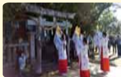
11月3日、横浜仁井田神社秋祭り

豊かな自然を守り、親しむ取り組みの1つで、横浜新町から鷲尾山山頂を目指します。よこせと地域を一望できる頂上でお弁当を食べたり、世代間交流をしながら、楽しい時間を過ごしてみませんか？