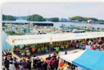
5月上旬、花火大会(主催者は別)

「にぎわいの創出」と「灘漁港付近の環境美化」を目的に開催しています。出店や新鮮な魚介類の販売、ビンゴゲームなど催しも充実！ご来場をお待ちしています♪