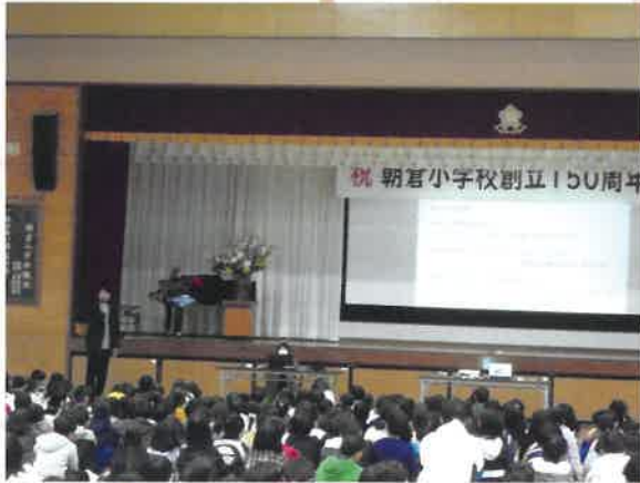
【朝倉小クイズの様子】