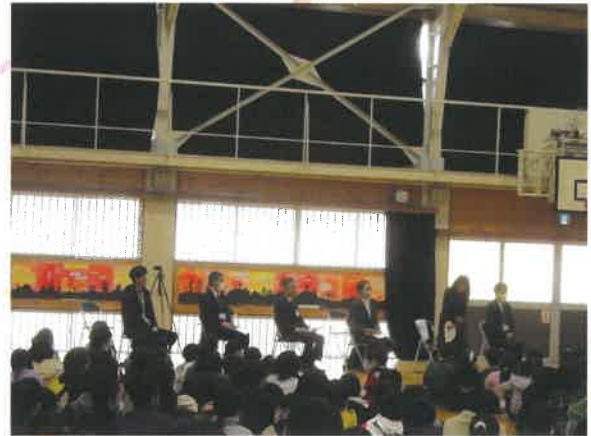
【3年生による150周年ポスター】

11月18日(土)に朝倉小学校創立150周年記念式を開催しました。本校は明治7年【1874年】に開校され、今年で150周年を迎える高知市で最も古い伝統のある小学校の一つであります。