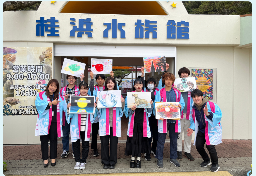
地域活動で紙芝居