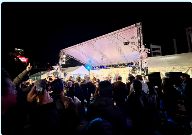
盛り上がるおきゃく