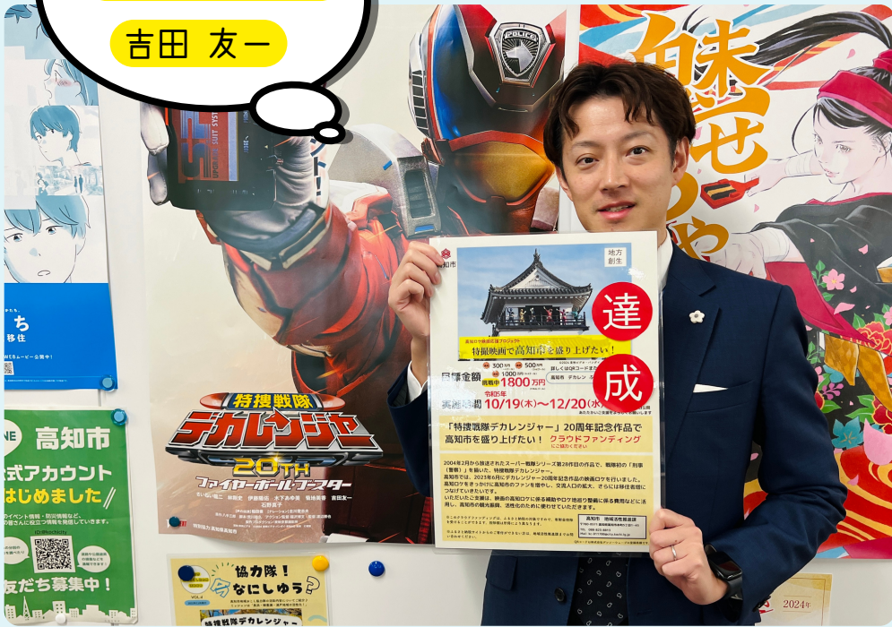
クラウドファンディング達成