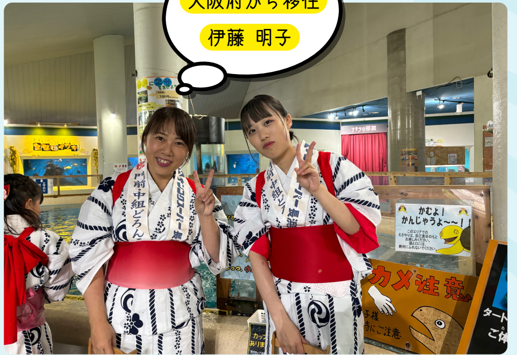
親子でどろんこ祭りに参加