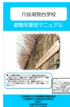
避難所運営マニュアル