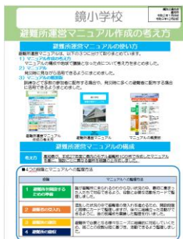
避難所運営マニュアル 作成の考え方

訓練などで多数の参加者に配布する場合や、発災時に多くの避難者に配布する場合に活用できるようまとめました。