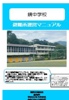
避難所運営マニュアル