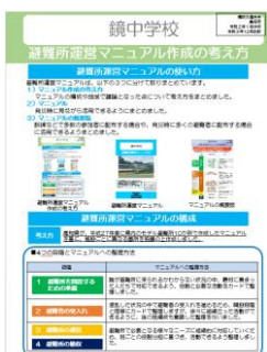
避難所運営マニュアル 作成の考え方

訓練などで多数の参加者に配布する場合や、発災時に多くの避難者に配布する場合に活用できるようまとめました。