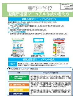
避難所運営マニュアル 作成の考え方