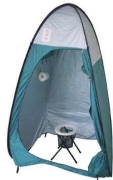
簡易トイレ設置 イメージ