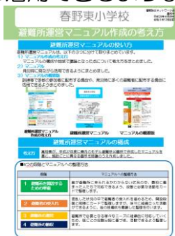
避難所運営マニュアル 作成の考え方

訓練などで多数の参加者に配布する場合や、発災時に多くの避難者に配布する場合に活用できるようまとめました。