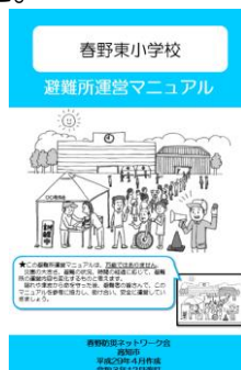
避難所運営マニュアル