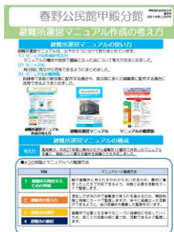
避難所運営マニュアル 作成の考え方

訓練などで多数の参加者に配布する場合や、発災時に多くの避難者に配布する場合に活用できるようまとめました。