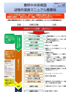
マニュアルの概要版