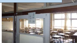
訓練時の区割りの様子