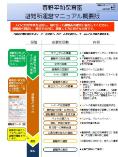
マニュアルの概要版