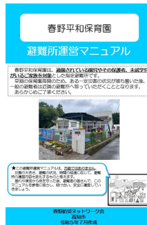
避難所運営マニュアル