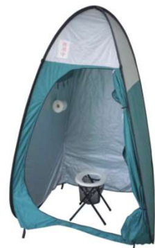
簡易トイレ設置 イメージ