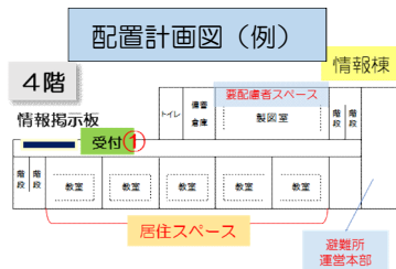
訓練時の区割りの様子