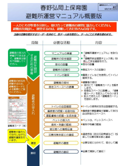
マニュアルの概要版