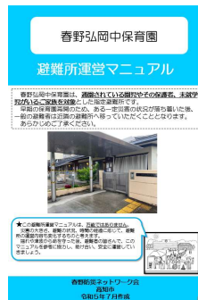
避難所運営マニュアル