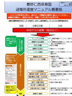
マニュアルの概要版