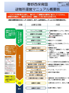
マニュアルの概要版