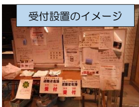
受付設置のイメージ