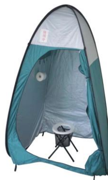
簡易トイレ設置 イメージ