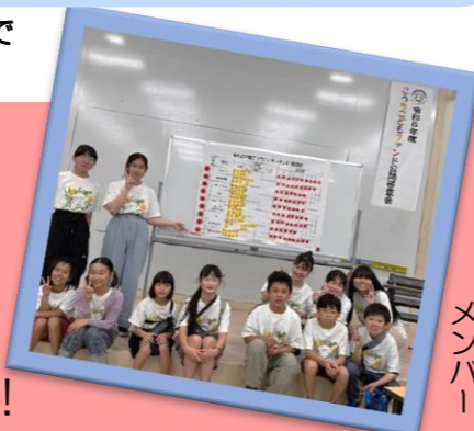
緊張から解放されたメンバー

6月16日、高知大学朝倉キャンパスで令和6年度公開審査があり参加しました。今回の発表メンバーには新しく加わった子どもたちの姿も!少し緊張している様子でしたが、大きな声で堂々と発表している姿に成長を感じました。こうちこどもファンド公開審査会は『審査員と応募団体、互いが納得するまで質疑応答をする』という高知型のオープンな審査会。①関わる人が全員楽しめる活動か?②活動の軸が明確で計画性がある活動か?③高知への愛があり、高知のまちがよくなるか?この3つの審査基準により助成が決まります。質疑応答では、『6年間の集大成とありましたが、どのような1年にしたいですか?』と聞かれ、『やり残したことが無いように、企画をしていきたい。全員がやって良かったと思えるものにしていきたい。悔いなく活動したい。』としっかりと応えていました。こどもファンド最後の1年をより良いものにしていけるような取り組みにしていきたいと思います。今年度の1番の取り組みは、久重地域の歴史についてです。久礼野にあったお城について学ぶ計画をしているそうです。久重の古(いにしえ)を学ぶ…楽しそうですね!助成して下さった企業や助成を決めて下さった審査員の方々の応援に応え、この1年思いきり学び、楽しんでください!