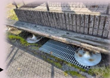
雨風にさらされ、傷みがみられる 小坂峠バス停のベンチ

投稿 「久重に観光名所を」 久重の見所を教えてほしい、観光案内の表示をしてほしい、トイレがない、見るところがないため、ただの通り道だけ。みんながまた来たい所にしてください 回答 すぐに対応できる課題ではありませんので、ご意見を真摯に受け止め、今後のまちづくりの中で検討していきます。