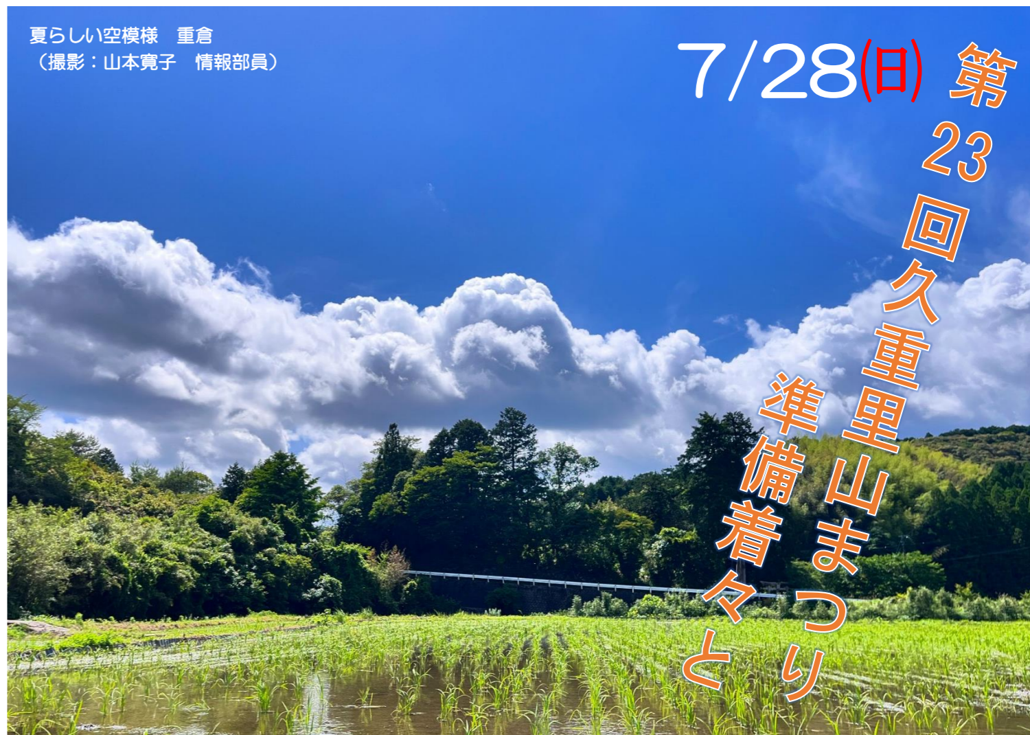
夏らしい空模様 重倉