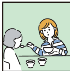
障がいや病気のある家族の身の回りの世話をしている。