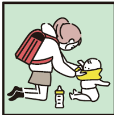
家族に代わり、幼いきょうだいの世話をしている。