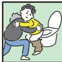
障がいや病気のある家族の入浴やトイレの介助をしている。

ヤングケアラーの支援については 市区町村の「こども家庭センター」 又は児童福祉担当部署までご連絡ください