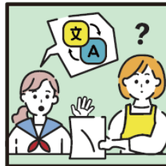
日本語が第一言語でない家族や障がいのある家族のために通訳をしている。