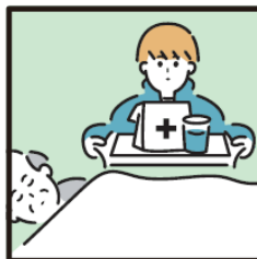
がん・難病・精神疾患など慢性的な病気の家族の看病をしている。