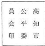
方30ミリメートル 字体 古字体 木印