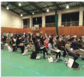
会場でビデオによる講習を受ける参加者

その他、自衛隊及び地元の方によるカレー等での炊き出し、パルクッキング料理もあり堪能されていました。