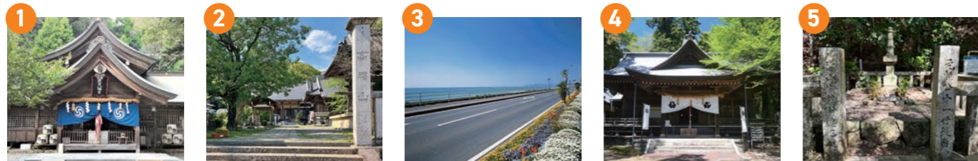
1 若宮八幡宮 +長宗我部元親像

25年間で四国のほぼ全土を手中に取めた長宗我部元親公が初陣戦勝を祈願したことで知られ、これをきっかけに改められた出陣鈴(でとんば)式建築の社殿が特徴的な神社です。