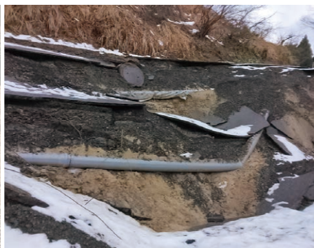
浄水場から配水池へ向かう水道管の破損・露出（輪島市）