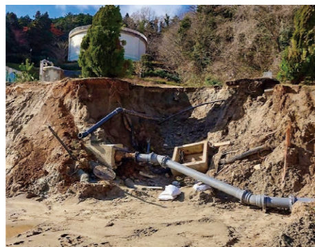
浄水場内の配管損傷（七尾市）

高知市上下水道局では、断水時の被害を小さくするため、基幹管路の耐震化を優先的に進めています。