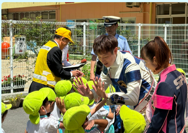
園児とハイタッチ