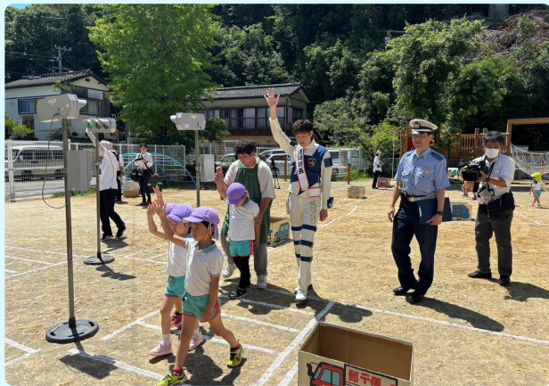
幼稚園での交通安全教室