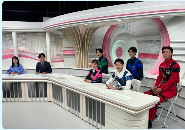
③テレビ局番組ジャック