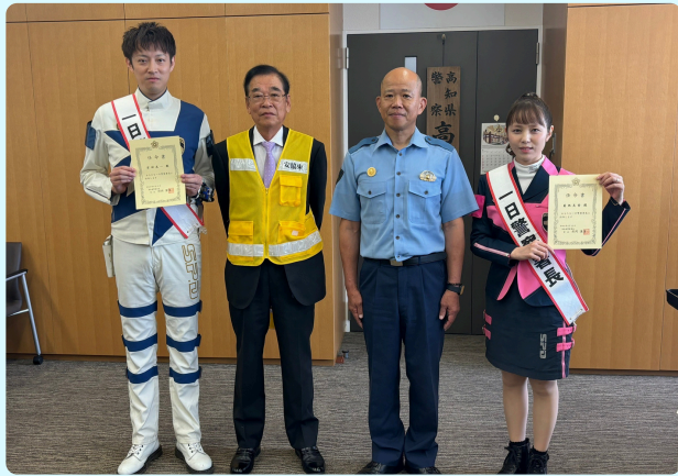
高知東署一日警察署長