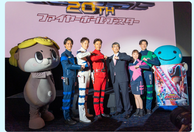
④高知凱旋舞台挨拶