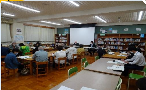
地域課題解決のための検討