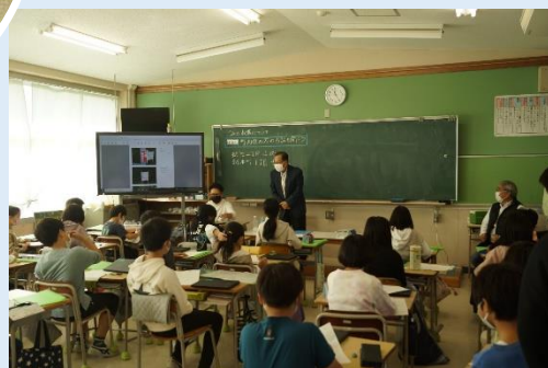
地域のごみ収集学習会