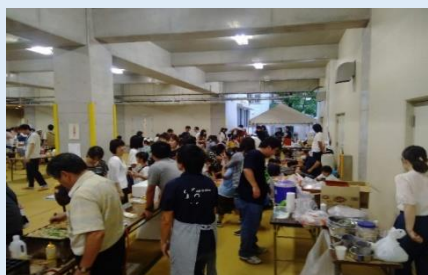
フェスティバルこよう