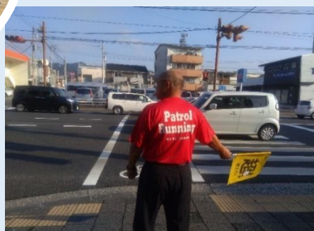
パトロール・ランニング

広域のかつ多世代に参加してもらうことで、顔の見える地域コミュニティの再構築につながった。