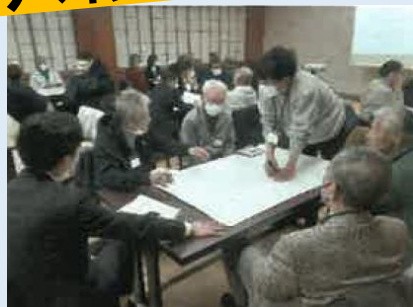
地域づくり講習会