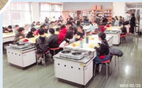
異世代交流推進事業（こども食堂）

地域の皆で活躍した人をたたえることができ、地域のために頑張る気持ちがより強くなった。