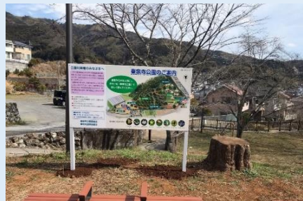
秦泉寺公園案内図の設置