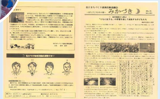
会報「みかづき」の発行