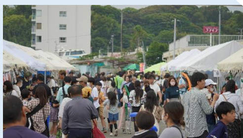
よこせと海辺のにぎわい市