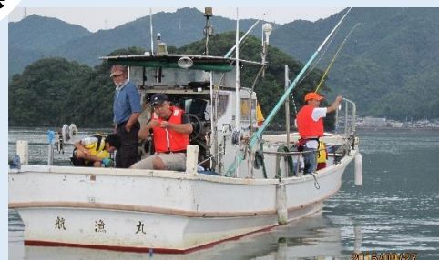
浦戸湾海洋調査ニロギ釣り

域外からの参加者を招くことにより、より多くの企画が出来他地域との交流も生まれた。イベントを通じた人との繋がりが次世代の人材育成や、防災力の向上に繋がった。