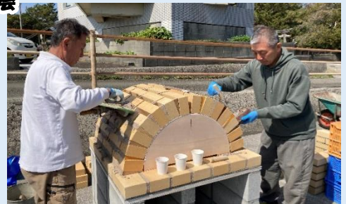
にぎわい交流事業

令和4年度は机や椅子の作製作業，令和5年度は拠点場所（施設）の整備及び外壁へのモニュメント作製を行った。