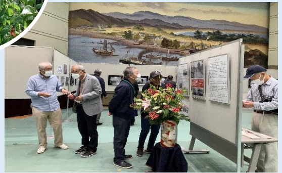
むかしの三里写真展