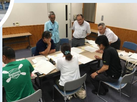
アンケート調査・分析

五台山地区に在住する小学生とその保護者を対象に実施した。地区の話聞いて知識を深めたり、炊き出し訓練等の実践訓練は良い経験となった。