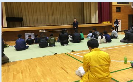
夜の学校～学校に泊まろう～