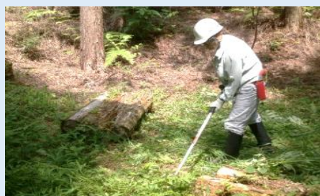
史跡看板設置及び北山管理