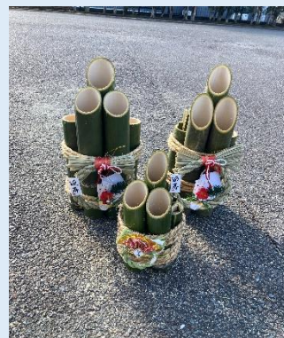
正月飾り作り教室