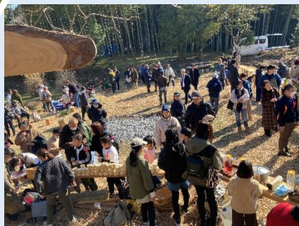
春の七草フェスタ