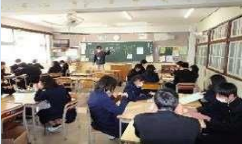
朝倉中学校防災学習発表