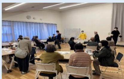
土佐市青年団視察研修