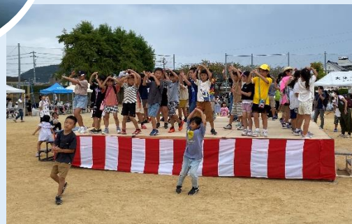
こじゃんと楽しむ！大津フェスティバル