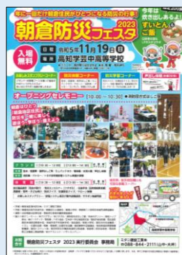
朝倉防災フェスタ