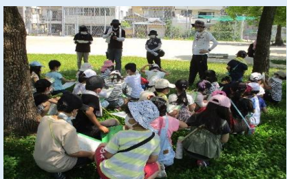
子どもたち（地域）の学習・生活支援 ～みなみ食堂・みなみ食堂～