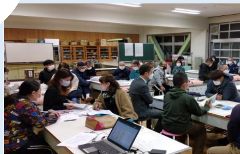
地域コミュニティの強化

小学校だけでなく、地域団体が連携し協力することによって、子どもたちの支援体制づくりができ、親にとっても心強い活動となった。