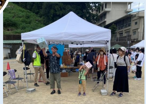
サマーフェスティバル