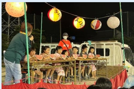
一宮東ふれあい夏祭り