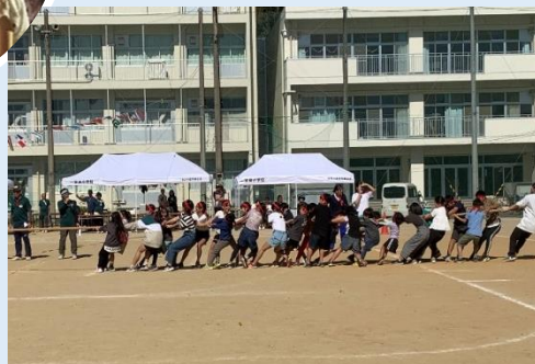
一宮東ふれあい運動会