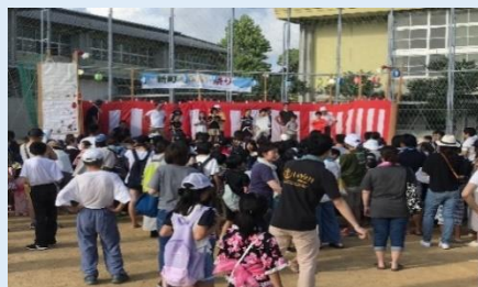
横浜新町ふれあい祭り