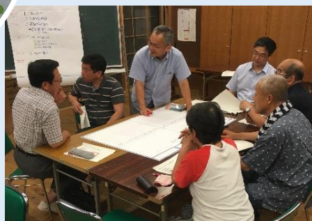
土佐山地域活性化計画検討事業