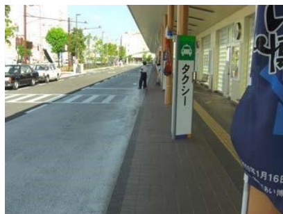
高速バス等降り口