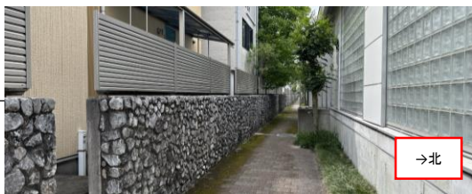
南側通路化粧擁壁及び目隠しフェンス