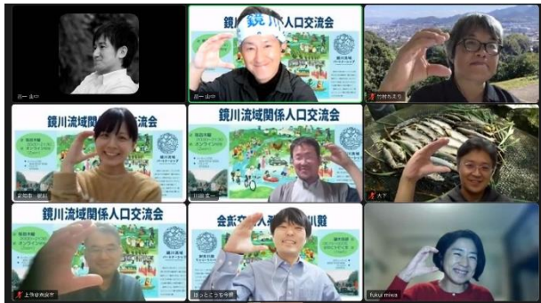
鏡川流域の形を表す「C」ポーズで記念撮影♪

まちのコイン「ぼっちり」のスポット「ぼっちり広報部」では、毎週木曜 20時から 21時半の間にオンライン交流会を開催しています。